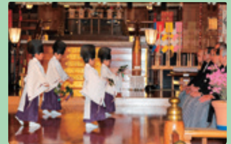
園児ら朝日子の舞奉奏